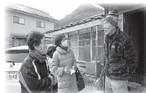
◀みまもり（声かけ） 訪問事業

在宅介護支援の一環として紙おむつの贈呈、みまもり（声かけ）訪問事業等の活動に活用されています。