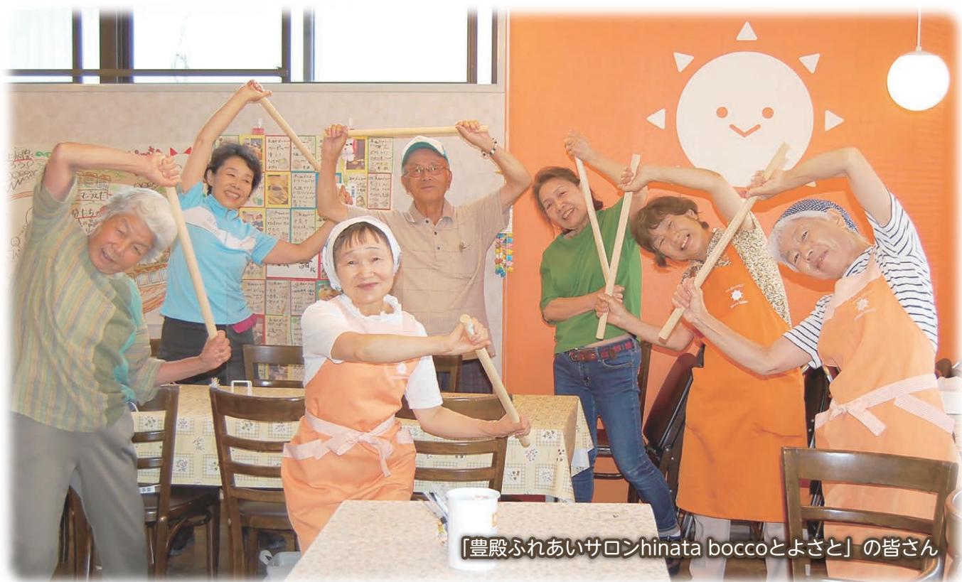
「豊殿ふれあいサロンhinata boccaとよさと」の皆さん