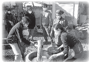
▲北常田自治会 世代間交流