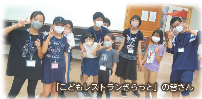
「こどもレストランきらっと」の皆さん