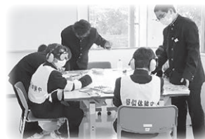
▲中学生の 高齢者疑似体験

小・中・高校生が疑似体験や座学を通じて、福祉への理解を深める活動に活用されています。