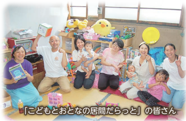
「こどもとおとなの居間だらっと」の皆さん