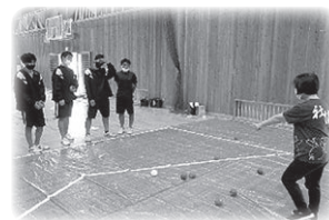
▲高校生の ボッチャ体験