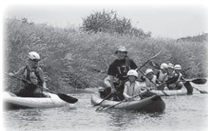
▲のびのび川遊び 体験教室

子育て世代を対象とした講座の開催や、結婚相談、法律相談等の事業に活用されています。